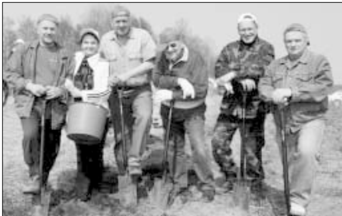
Rotariečiai mielai medelius sodintų ir dažniau

Iš penkių padirbėjusių sodintojų laukė kareiviška košė, o grįždami namo rotariečiai garsiai svarstė, kaip būtų smagu šį pavasarį suorganizuoti dar vieną sodinimo akciją.