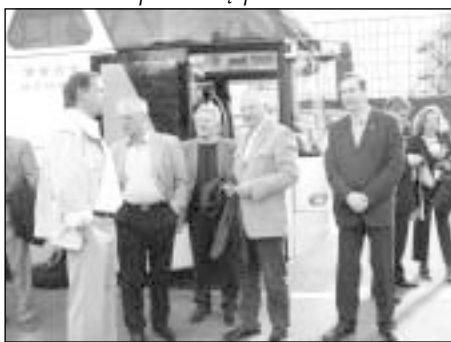
Rotariečiams patiktų autobusu keliauti kiekvieną pavasarį

tuvių, kavinių, teniso kortų. Nors oras nebuvo geras – lijo lietus – dviratininkų Amsterdamo gatvėse netrūko.