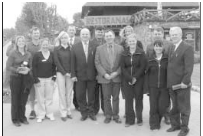
Raseiniškiai svečius vaišino garsiojoje „Karpynėje“