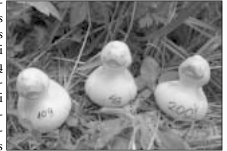
Pirmieji trys atplaukę ančiukai savo savininkams laimėjo prizus

Antrus metus iš eilės ančiukų varžybas organizavę Vilniaus Rotaract klubo nariai džiaugėsi sau draugų bei Rotary narių entuziazmu, kurie mielai pirko ančiukus, o daugelis jų atvyko ir į pačias varžybas. Patirtis parodė, kad originali idėja ir gražus tikslas – patrauklūs visuome-