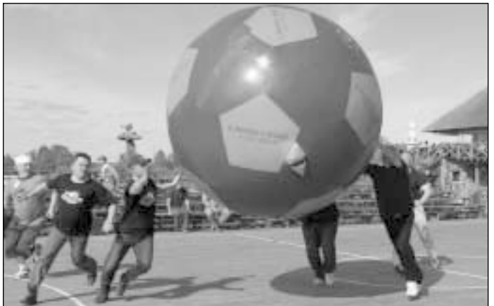
Viena azartiškiausių rungčių tapo „Mega“ futbolas

Karpiados šeimininkai apgailestavo, kad į šventę atvyko mažiau dalyvių nei tikėtasi – rungtyse dalyvavo ir karpis meškėriotojų rotariečiai iš dešimties šalies klubų. Nepaisant to, raseiniškiai tiki, jog dalyvių entuziazmas bei gera nuotaika paskatins, kad 2007 m. įvyktų antroji Rotary vasaros stovykla, kurioje tikimasi sulaukti gausaus rotariečių būrio iš visos Lietuvos.