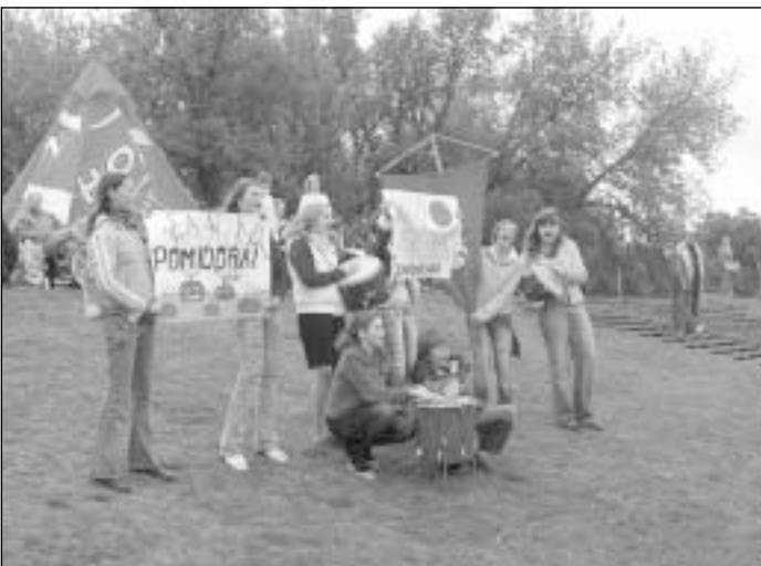
Dalyvius į varžybas atlydėjo pasirenge sirgaliai