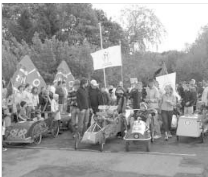
Mašinėlių kūrėjai į gaminius „sudėjo“ ne tik technines žinias, bet ir savo fantaziją

Varžybose dalyvavusios komandos turėjo ne tik įveikti mašinėlių trasą, tačiau taip pat pademonstruoti savo komandos prisistatymą, dalyvauti labdaringuose javainių pardavimuose, šaudyti iš lanko bei sumėtyti šiukšles į konteinerius.