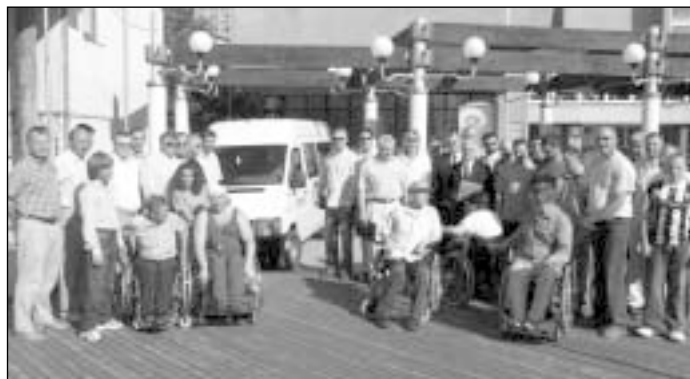
Specialiems poreikiams pritaikytu autobusu neįgalūs sportininkai vyks į Lietuvoje ir užsienyje vykstančias sporto varžybas

Autobusas, kuriuo fizinę negalią turintys, bet sportą mėgstantys šiauliečiai galės važinėti į varžybas – dalis Matching Grant projekto, kurį Šiaulių RK vykdė drauge su Fredericijos (Danija) Rotary klubais. Rotariečiai „Entuziastui“ taip pat yra pažadėję sporto įrangos, kompensacinės technikos, kitų reikalingų