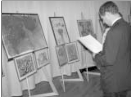
Už tris dešimtis neįgalių vaikų sukurtų dailės darbų rotariečiai surinko per 10 tūkst. litų

Š.m. balandžio 24 dieną „Neringos“ restorane įvyko vaikų su negalia piešinių labdaros aukcionas, kurį organizavo Vilniaus RK „Perkūnas“. Labdaros aukcione buvo pristatyti 29 dailės darbai, kuriuos renginio dalyviai išpirkė per mažiau nei porą valandų.