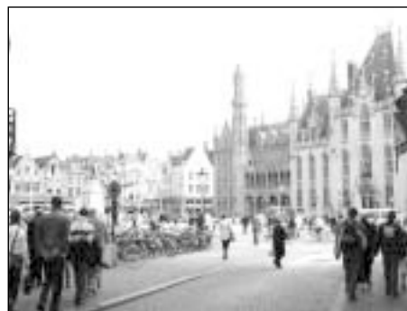
Briugė keliautojus žavėjo bažnyčiomis ir savo bokštais

Kitą dieną buvo numatyta dalykinė programa – lankėmės Europos Parlamente, kur susipažinome su europarlamentarų veikla, o informacijos centre susirinkome lankytojams skirtos medžiagos, kurią parvežėme į savo darbovietes. E.Gentvilas mums pasakojo, kad „Briuselis“ nėra nuo likusios Europos atskirta slapta jėga, primetanti savo valią 455 mln. ES piliečių. Supratome, kad čia priimami sprendimai yra atviro ir demokratiško proceso rezultatas. Šiame procese dalyvauja trys pagrindinės ES institucijos: Europos Parlamentas, Europos Sąjungos Taryba ir Europos Komisija. Sprendimai priimami institucijoms bendradarbiaujant ir derinant 25 valstybių interesus.