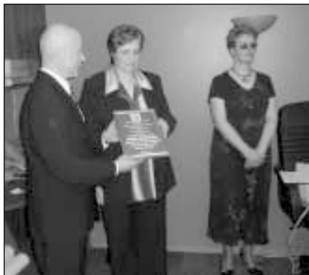
Rotariečiai „Varpelio“ ugdymo centrui dovanojo relaksacijos kambarį

Š.m. gegužės 13 d. Kupiškio rotariečiai savo bičiulių iš Danijos Bronshoj RK ir Assens RK bei Vokietijos Plon RK pagalba nudžiugino Kupiškio miesto bei rajono neįgalius vaikus ir jaunuolius „Varpelio“ ugdymo centre atidarydami relaksacijos kambarį.