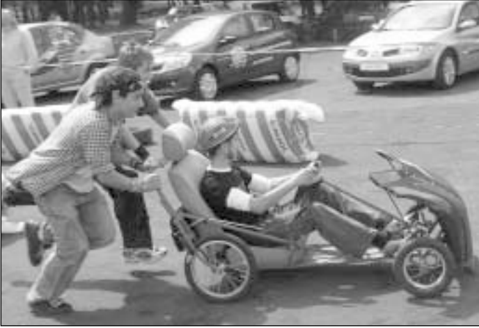
Komandos nariai varžėsi stumdami mašinėlės per kliūčių ruožą